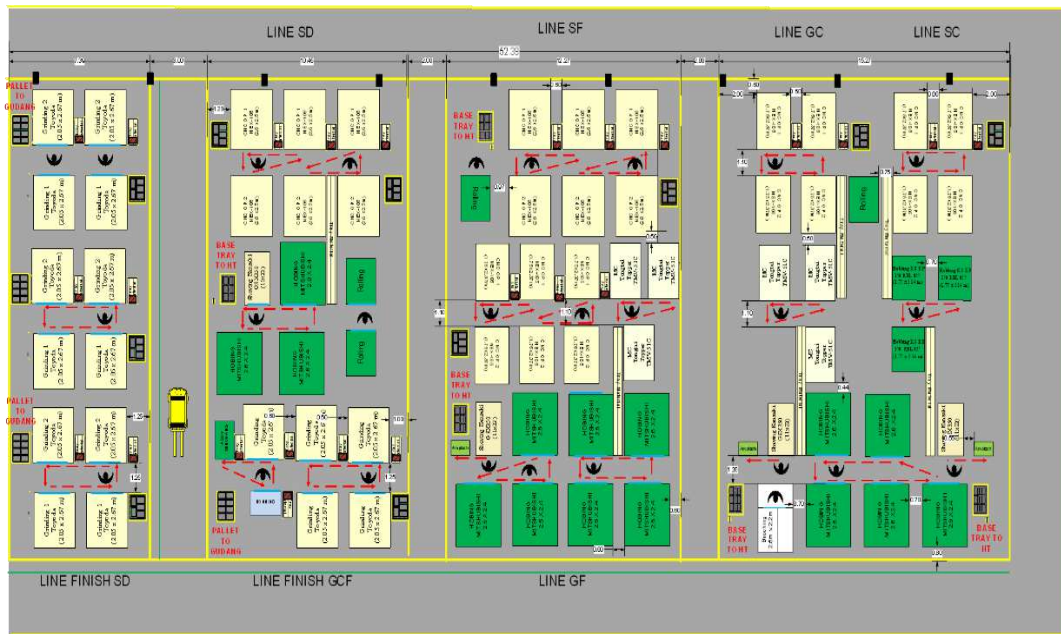
Gambar 3. Detail Rancangan Tata Letak Lini Transmisi

Berdasarkan rancangan alternatif tata letak I, maka dapat dibuat detail rancangan tata letak lini transmisi dengan mempertimbangkan batasan praktis dan modifikasi yang diperlukan. Detail rancangan tata letak lini transmisi dapat dilihat pada Gambar 3.