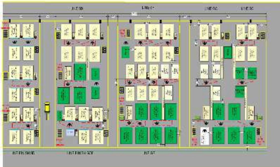
Gambar 3. Detail Rancangan Tata Letak Lini Transmisi

Berdasarkan Gambar 3, dapat dilihat bahwa lini transmisi terbagi menjadi 8 (delapan) departemen, yaitu lini SC, GC, SD, SF, GF, GCF, finish SD, dan finish GC. Lini SC membutuhkan mesin sebanyak 10 unit. Lini GC membutuhkan mesin sebanyak 15 unit. Lini SD membutuhkan mesin sebanyak 12 unit. Lini SF membutuhkan mesin sebanyak 7 unit. Sedangkan lini GF membutuhkan mesin sebanyak 12 unit. Lini GF membutuhkan mesin sebanyak 18 unit. Lini GCF membutuhkan mesin sebanyak 7 unit. Lini finish SC membutuhkan mesin sebanyak 4 unit. Sedangkan, lini finish SD membutuhkan mesin sebanyak 8 unit.